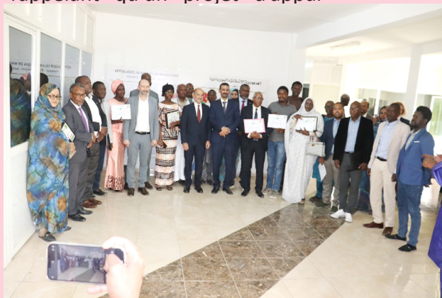
Cérémonie de remise d'attestations de formation aux participants

ses remerciements à l'Ambassade de France et au service de coopération, et déclare : "nous allons établir un partenariat fécond avec la coopération française, et explorer d'autres pistes de coopération", tout en rappelant qu'un projet d'appui