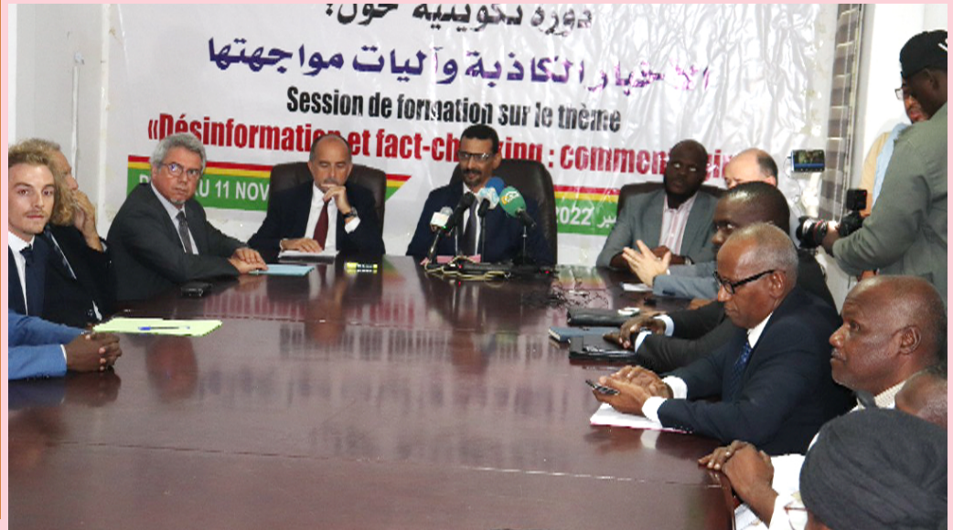
Vue partielle des participants à la formation

Du 07 au 11 novembre 2022, la HAPA, en collaboration avec l'ambassade de France, L'École Publique du Journalisme de Tours (EPJT) et Médias et Démocratie, a organisé une session de formation sur le thème de la « Désinformation et Fact checking » : comment agir, pour une vingtaine de journalistes.