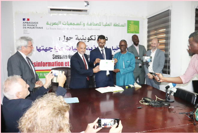
Séance de remise d'attestation